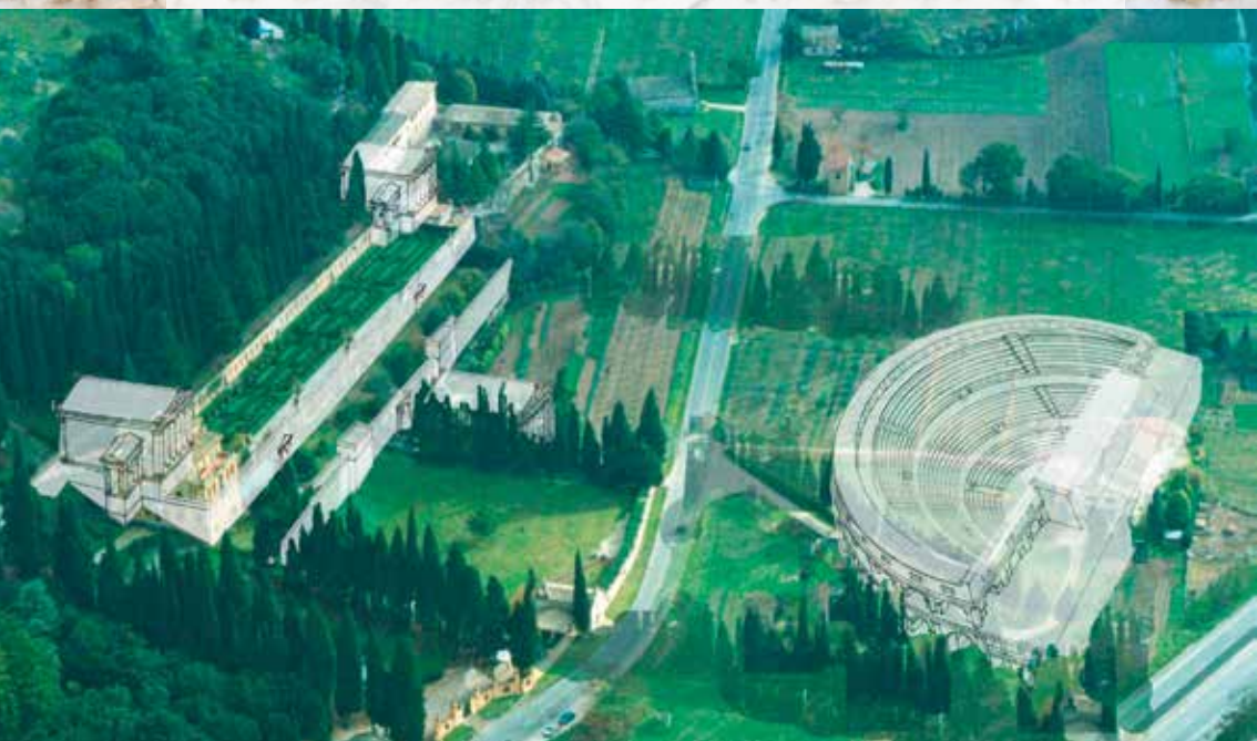
Villa Fidelia: ricostruzione Santuario Federale degli Umbri (P. Camerieri)

LA RIEVOCAZIONE STORICA HISPELLVM è un'iniziativa ideata e organizzata dall'Associazione Culturale HISPELLVM APS che si avvale del contributo di un Comitato Scientifico composto da studiosi, storici, storici dell'arte, archeologi e da un nutrito gruppo di appassionati, volontarie e volontari. Dal 2020 è regolarmente iscritta al RUNTS – Registro Unico Nazionale Terzo Settore. Le sue origini risalgono però al 31 luglio 2012 quando Amministrazione Comunale, Pro Loco IAT, Spello e Terzieri (Porta Chiusa, Mezota, Pusterula) decidono di fondare l'Associazione Culturale HISPELLVM con lo scopo di accendere un riflettore sugli antichi fasti della Spello romana, dando così vita a giorni di eventi unici. In questa edizione si arricchisce di un'anteprima che offre esperienze storico artistiche e culinarie uniche.